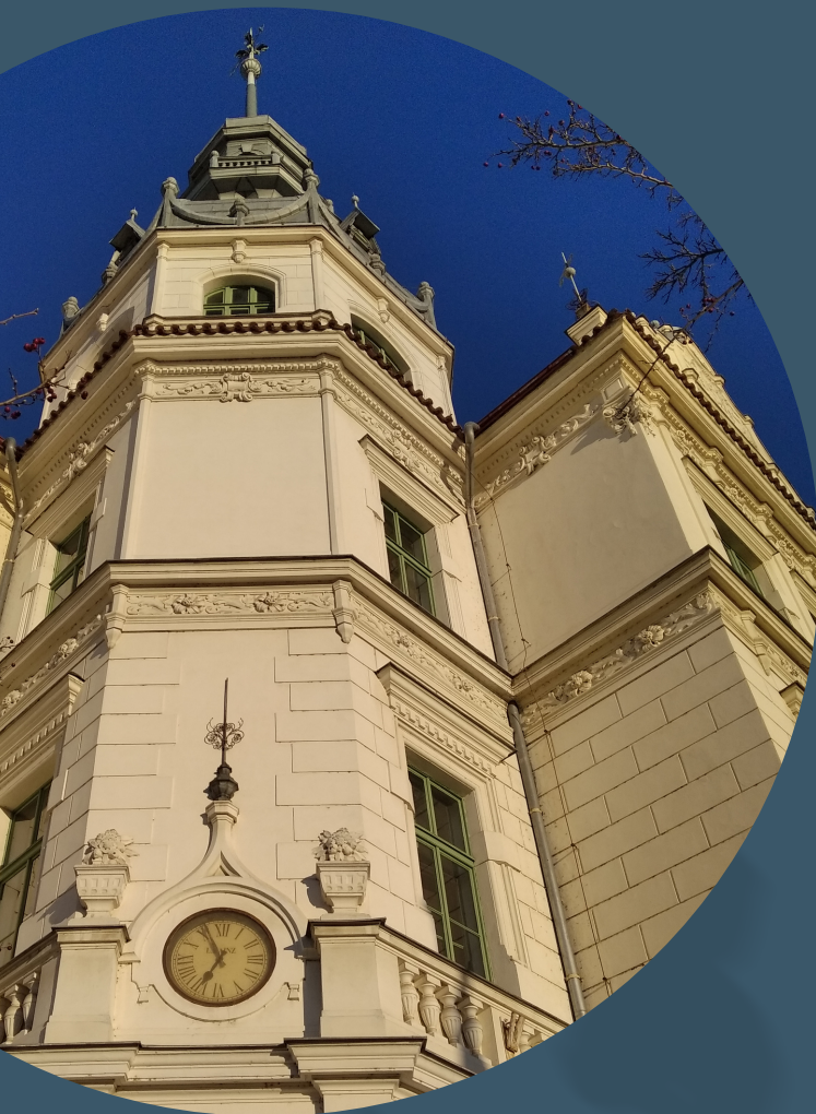
Gymnázium Bohumila Hrabala v Nymburce